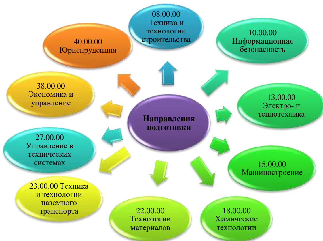
Рисунок 1. Образовательные программы

В Академии реализуются образовательные программы среднего профессионального образования подготовки специалистов среднего звена по следующим укрупненным группам: